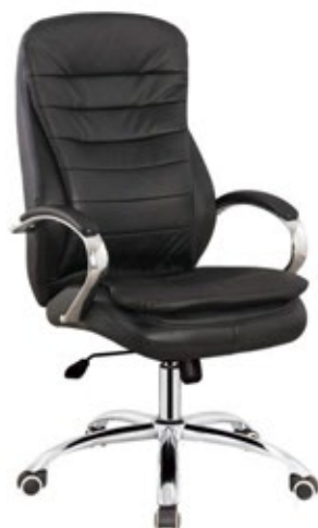
STRUASH Presidente / Anatómica