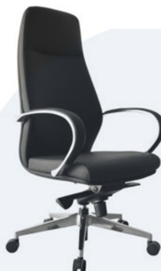
SANTORINI Presidente / Anatómica