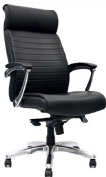
HANCOCK Presidente / Anatómica