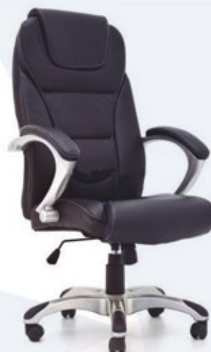
HAMPTON Presidente / Anatómica